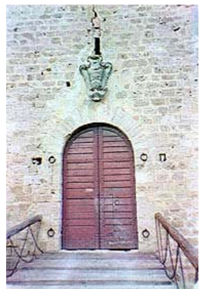
L'ingresso principale sovrastato da uno stemma in pietra.

Il castello di Strozzevolpe è la più importante delle fortificazioni minori che circondavano l'abitato di Poggibonsi, oltre che l'unica giunta praticamente intatta a noi. Sorge su un colle di fronte al "Poggio Bonizio" dove fu iniziato, e mai portato a termine, il progetto Mediceo della costruzione di una fortezza (" Fortezza dell'Imperatore ") e di una nuova città fortificata. Già ricordato come 'Scoriavolpe' in un documento del 1154, passò durante il 1330 dalla famiglia Salimbeni agli Adimari di Firenze. Il castello conserva ancora il perimetro irregolare delle mura medievali con l'accesso tramite una torre, l'antico cassero, il cui aspetto attuale è però frutto di una ricostruzione ottocentesca. L'immagine della costruzione, merlata e turrita, nel suo insieme è molto scenografica ma la sua perfezione è andata a scapito della sua originalità, essendo stata restaurata in più parti. Oggi è sede di abitazione di privati e i suoi saloni ospitano una bella collezione di armi antiche.