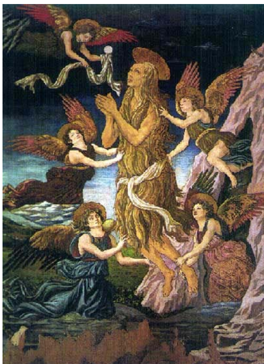
Museo del Pollaiolo – Comunione mistica di Santa Maria Maddalena di Antonio del Pollaiuolo

Il minuscolo ma prezioso museo di Staggia Senese ospita un'opera di grandissimo pregio di Antonio del Pollaiuolo , la Santa Maria Maddalena, alcune tavole di Scuola Senese e Fiorentina dei secoli XIV e XV, una bella tela del Salimbeni e alcuni preziosi oggetti di arte sacra.