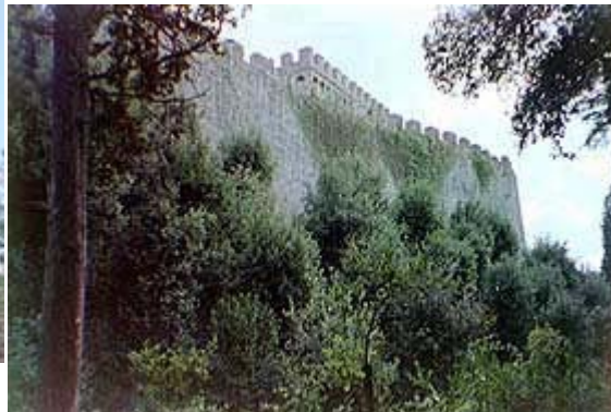
Le cortine murarie