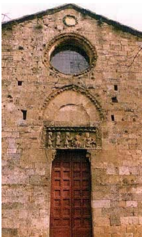
Chiesa di Talciona

Riprendete la visita svoltando a destra nella strada principale, per arrivare alla confluenza con la SP 130 e svoltare nuovamente a destra in direzione Talciona .