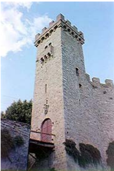
La Torre con l'ingresso principale originariamente con ponte levatoio.

Il castello di Strozzevolpe è la più importante delle fortificazioni minori che circondavano l'abitato di Poggibonsi, oltre che l'unica giunta praticamente intatta a noi. Sorge su un colle di fronte al "Poggio Bonizio" dove fu iniziato, e mai portato a termine, il progetto Mediceo della costruzione di una fortezza (" Fortezza dell'Imperatore ") e di una nuova città fortificata. Già ricordato come 'Scoriavolpe' in un documento del 1154, passò durante il 1330 dalla famiglia Salimbeni agli Adimari di Firenze. Il castello conserva ancora il perimetro irregolare delle mura medievali con l'accesso tramite una torre, l'antico cassero, il cui aspetto attuale è però frutto di una ricostruzione ottocentesca. L'immagine della costruzione, merlata e turrita, nel suo insieme è molto scenografica ma la sua perfezione è andata a scapito della sua originalità, essendo stata restaurata in più parti. Oggi è sede di abitazione di privati e i suoi saloni ospitano una bella collezione di armi antiche.