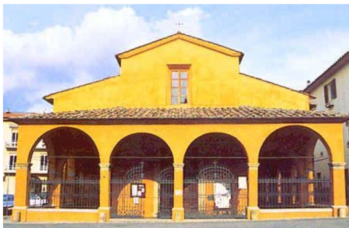
Santuario di Romituzzo

Percorrendo la Cassia, alla periferia sud di Poggibonsi, troviamo il Santuario di Romituzzo . Questo nome derivò dal romitaggio che alcune donne avevano stabilito in quel luogo, allora solitario, già all'inizio del 1300.