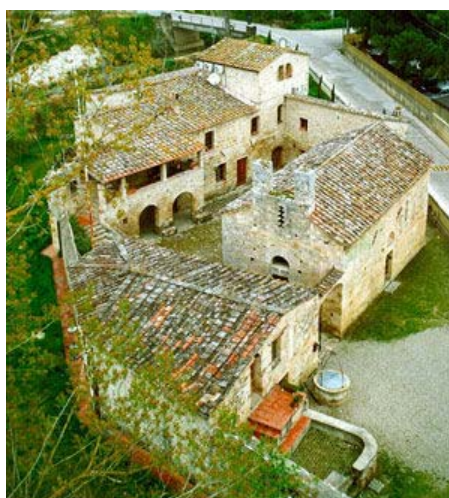
Magione di San Giovanni al Ponte

Sede dell'antico "spedale" dedicato all'assistenza dei pellegrini che percorrevano la "Francigena", il piccolo ma splendido complesso monumentale - chiesa, foresteria e servizi complementari - rappresenta un raro esempio di conservazione e ripristino di strutture medievali, riferibili al XII secolo.