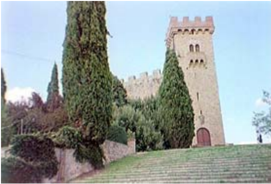
La scalinata che porta all'ingresso principale

Raggiungete la zona degli impianti sportivi del Bernino (che si trova proseguendo oltre via del Colombaio) e dirigetevi verso il Castello di Strozzevolpe percorrendo la strada sterrata in direzione Il Tresto (bivio sulla sinistra dopo il complesso sportivo. Fate attenzione al manto stradale!). Percorsi circa 2 km vi troverete a Luco, con il Castello di Strozzevolpe che sorge su un'altura ai margini di Poggibonsi